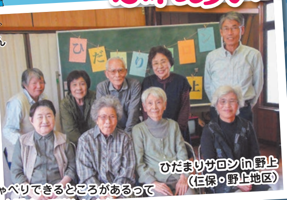
ひだまりサロンの野上 (仁保・野上地区)

「おしゃべりできる場所があるって嬉しい!話すと楽しい!」コロナ禍でおしゃべりや会食ができなかったのがきっかけでサロンを開設しました。地域の絆が強まり、つながりがあることの大切さと素晴らしさを感じています。