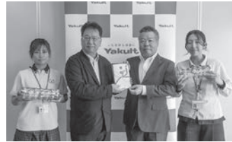
株式会社 ヤクルト山陽 様