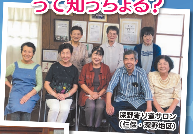
深野寄り道サロン (仁保・深野地区)

「おしゃべりできる場所があるって嬉しい!話すと楽しい!」コロナ禍でおしゃべりや会食ができなかったのがきっかけでサロンを開設しました。地域の絆が強まり、つながりがあることの大切さと素晴らしさを感じています。