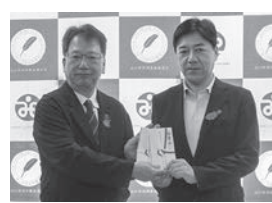
令和6年10月16日 (株)三宅商事 様