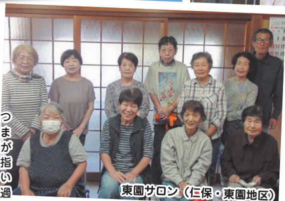
東園サロン (仁保・東園地区)

「サロンの日は月1回の楽しみな日!」音楽鑑賞や講座の聴講、会長手作りケーキを食べながらの茶話会など…。いろんなことをして楽しんでいます!これからも色々計画。地域とのふれあいができることがサロンの良さですね!